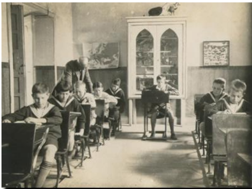
Salón de clase en 1925

Mirad esta foto. ¿Cuáles son las diferencias entre este salón de clase y el nuestro?